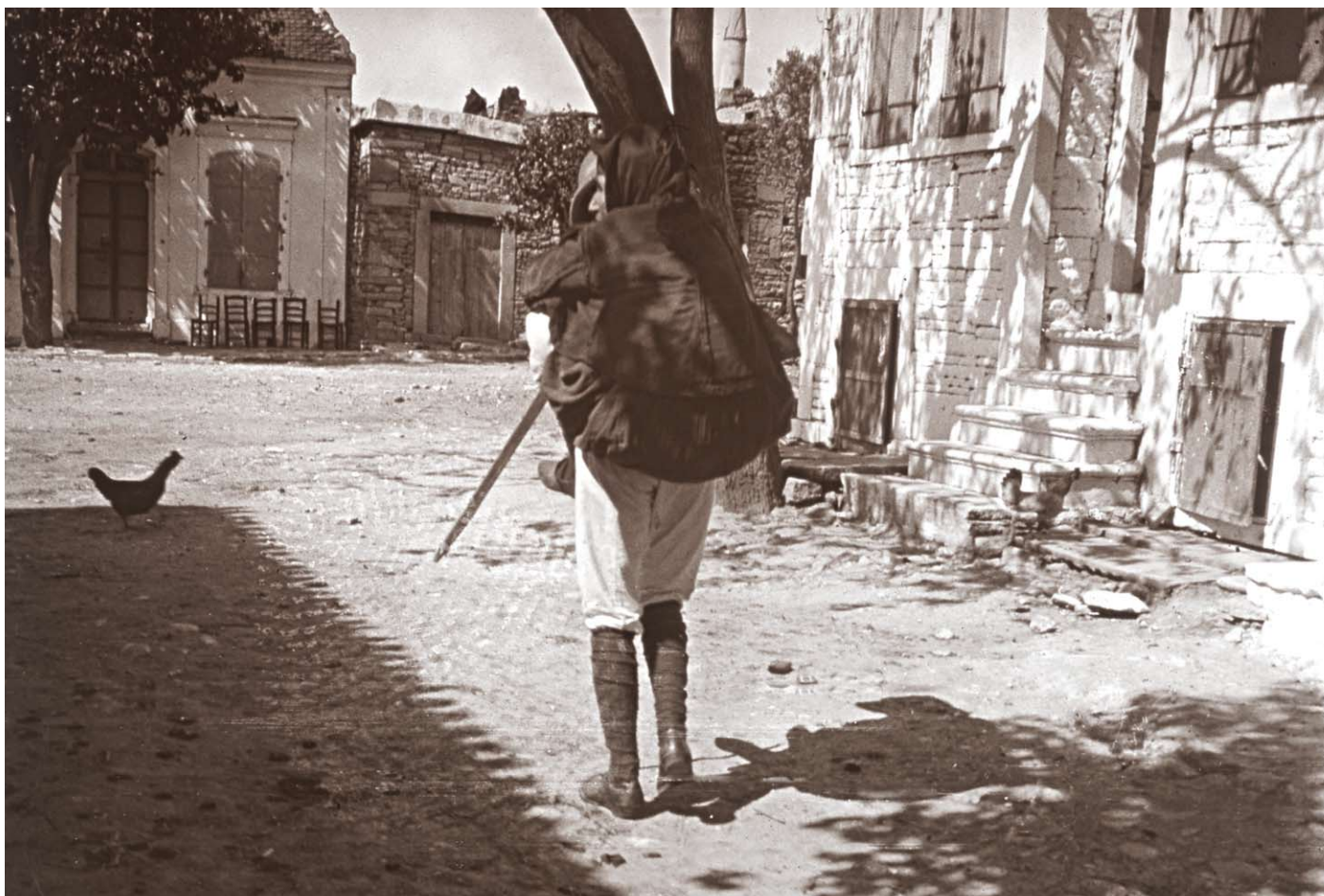
Nouvelle Phocée d'Asie Mineure. Un archéologue français porte sur son dos une femme âgée pour la conduire au port, 18 juin 1914.